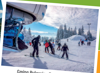
Gmina Bukowina Tatrzańska