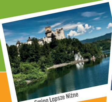
Gmina Łapsze Niżne