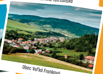
Obec Veľká Franková