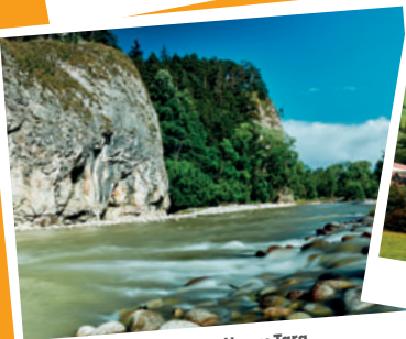
Gmina Nowy Targ